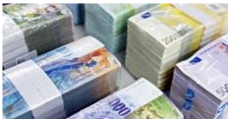
Solo i soldi contanti derivano dalla Banca nazionale

Con la riduzione dei debiti non ci sono più soldi, al contrario, complessivamente ce ne sono di meno .